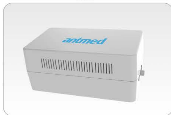
• 24VAC 电源箱