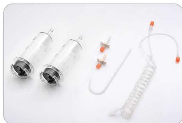
• 200ml针筒用于造影剂注射 • 200ml针筒用于盐水注射