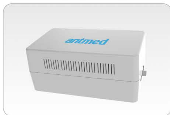
• 24VDC 电源箱