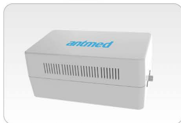
• 24VDC 电源箱