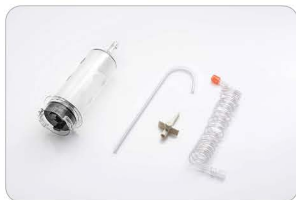
• 200ml针筒用于造影剂注射